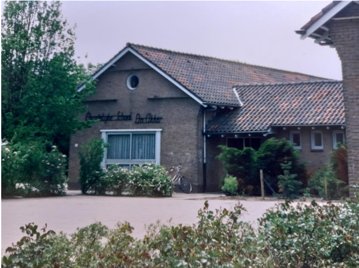
Het schoolgebouw in vroeger tijden

In 2013 moest D'n Bogerd de deur sluiten, omdat er te weinig kinderen meer waren. Sinds die tijd heeft D'n Akker de ruimte van D'n Bogerd deels in gebruik genomen. Daarnaast heeft ook de kinderopvang een lokaal in het gebouw.